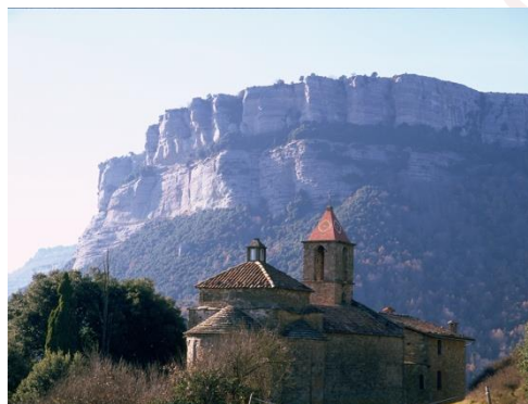
Sant Joan de Fàbregues

A cavall d'Osona i la Garrotxa, el caràcter muntanyenc de l'etapa ens deixarà satisfets.