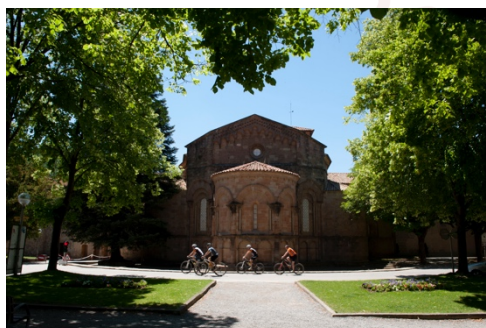
Exterior del monestir

Aquesta es tracta d'una etapa curta, en la seva major part de descens, d'arribada. De Vallfogona a Sant Joan de les Abadesses el paisatge ens indica Ripollès, però també ens indica història. El pas dels homes per aquestes contrades ha deixat un reguitzell de camins, masies, planes antigament cultivades i detalls que el caminador sap copsar, però si hi ha quelcom que veritablement captiva a qualsevol és la riquesa del patrimoni arquitectònic d'ambdues poblacions germanes.