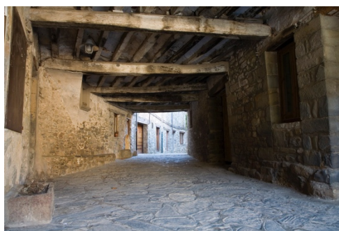
Vallfogona Nucli Medieval