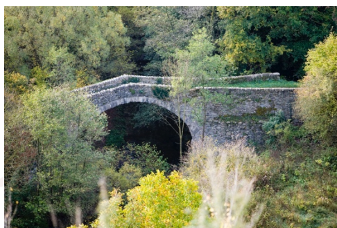
Vallfogona Pont Medieval