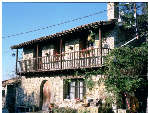
Casa del poble

La ruta que uneix Tavertet i Rupit, és un clàssic dels clàssics, una etapa perfecte amb tots els ingredients per a seduir a caminants i a excursionistes. Les increïbles vistes que ofereix la cinglera no tenen comparació, les masies que descobrim al pas son úniques i de gran antigor, la vegetació variada i ufana, de rouredes mil·lenàries a fagedes exquisides i a les bagues més fresques. Finalment Rupit, un autèntic pessebre 365 dies l'any, un representant perfecte de l'arquitectura de poble de muntanya català amb una gastronomia coneguda i uns productes locals de terra rica i autèntica.