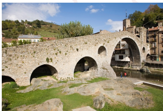
Pont nou de Camprodon

L'etapa que uneix Sant Joan de les Abadesses i Camprodon és una etapa tranquil·la, sense massa desnivells ni passos complicats, més aviat un passeig tranquil entre boscúria, conreus i pagesia del mig-alt Ripollès. L'arribada a Camprodon és benvinguda, rica i plena de coses a tastar.