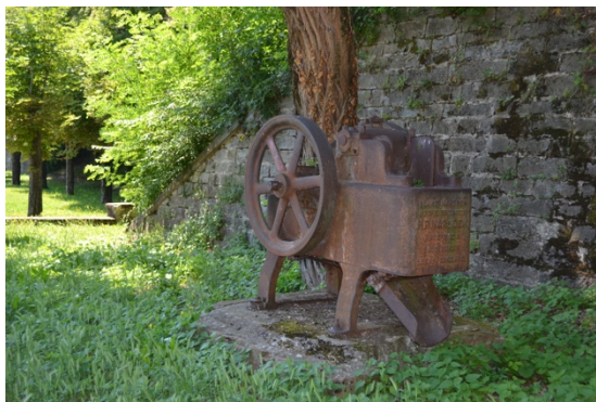
La Farga de Bebié