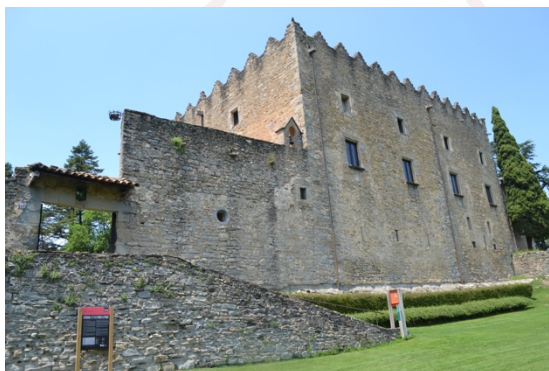
Castell de Montesquiú

El tram que uneix Santa Maria de Besora amb la Farga de Bebié, és un tram curt de no massa dificultat i amb el descens com a protagonista, car anem a retrobar el Ter. La bellesa d'aquesta etapa la localitzem en la troballa dels castells, primer el castell de Besora, data del s.IX i malauradament en ruïnes, acompanyat de l'església romànica de Santa Maria.