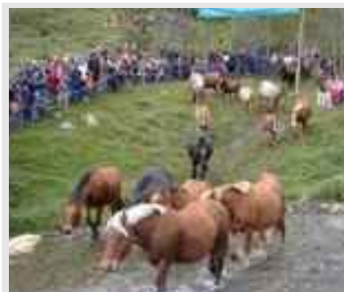
Trià de mulats de Espinavell, foire de bestiaux.