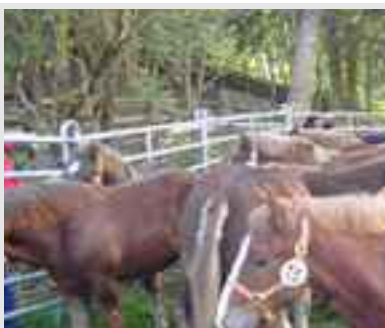
Trià de mulats de Espinavell, foire de bestiaux.