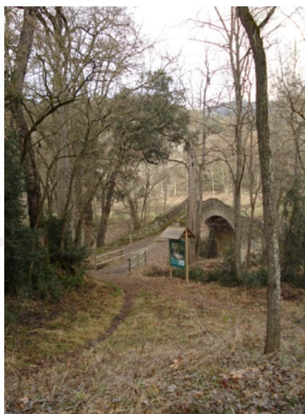
Pont de St. Pere de Torelló