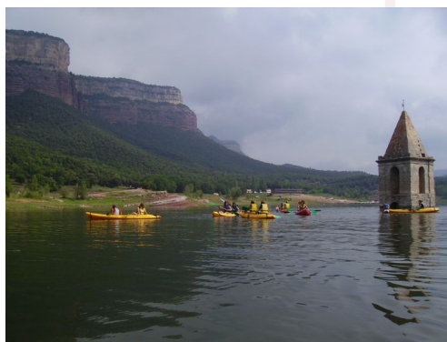
Canoes Sau - Pachamama