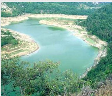
Vue de retenue de Sau de jour.