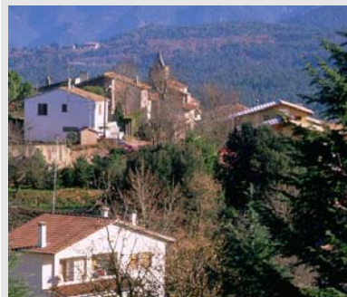
Vilanova de Sau