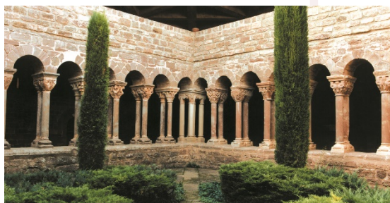
Claustre de Sta. Maria de l'Estany

El camí del Bisbe i Abat Oliba, pren des d'aquí un nou caire, del secà del cor de Catalunya a les verdes pastures d'Osona i el Ripollès.