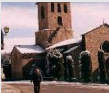
Le Monastère de l'Estany.