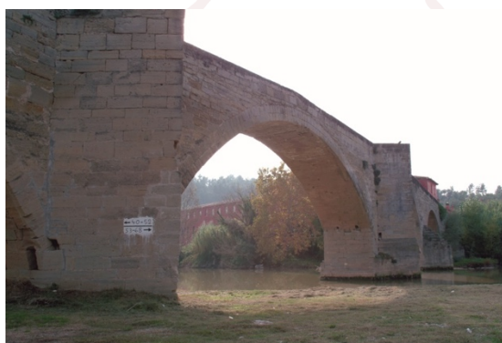
Pont Vell de Navarcles

De Navarcles, acaronat pel Llobregat i la riera de Calders a Artés, una població vinícola amb un fort lligam a les tradicions de la terra i la seva cultura, en destaquen les festes de Sant Joan i la festa de la Verema, un camí planer i una excursió relaxada entre conreus de secà i àrees de pi.