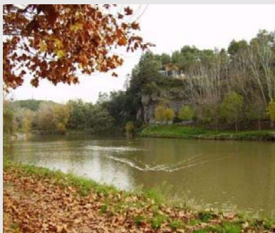
Parc de Navarcles.