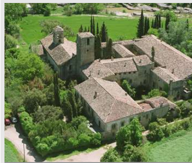
Sant Benet de Bages.