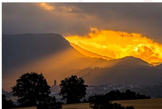
Espectacle a l'albada. Carme Molist